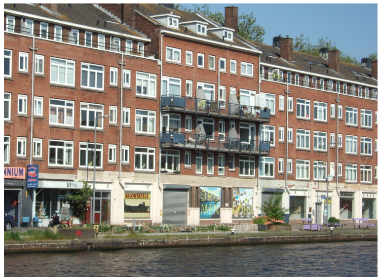
Centrum Schiezicht aan de Spangesekeade in het hart van het bouwblok (situatie nov. 2013)

Er is een apart projectplan met een uitgebreide beschrijving van de opzet van het Centrum en de exploitatie.