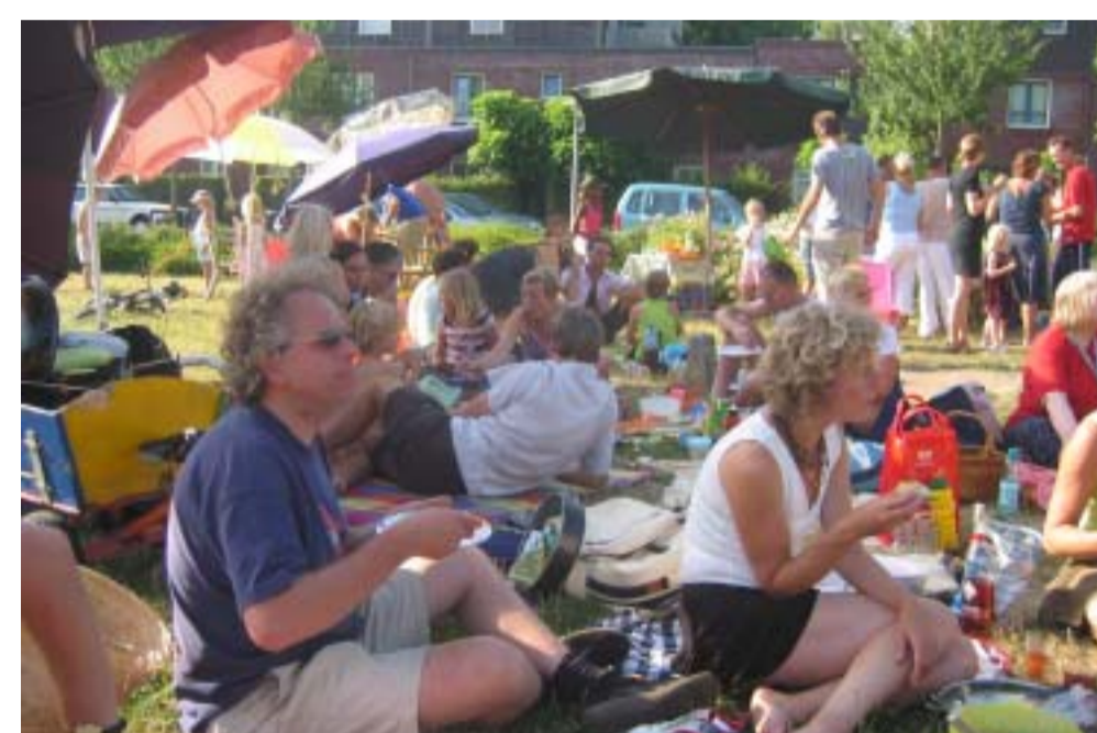
5: BUURT ACTIVITEITEN OP KADE