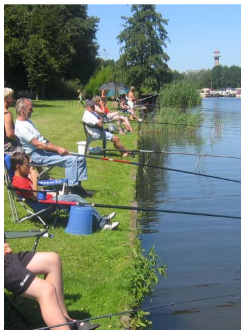
1: WATER ALS RECREATIE