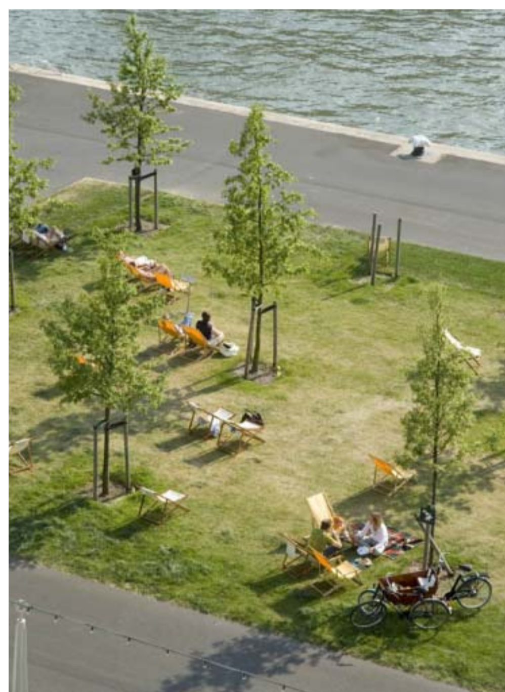
2: NIET PARKEREN MAAR RECREËREN