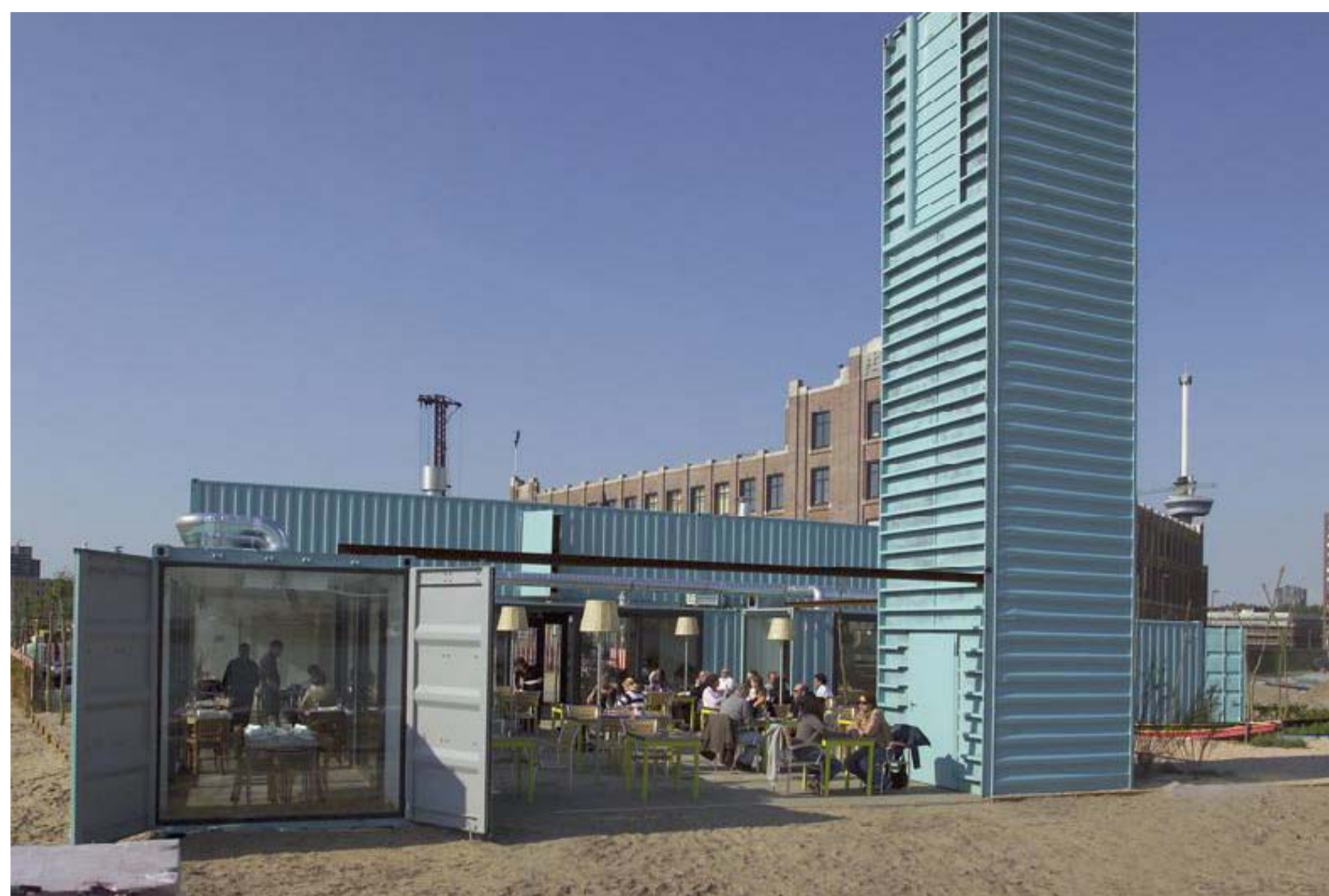
3: RESTAURANT OP KADE