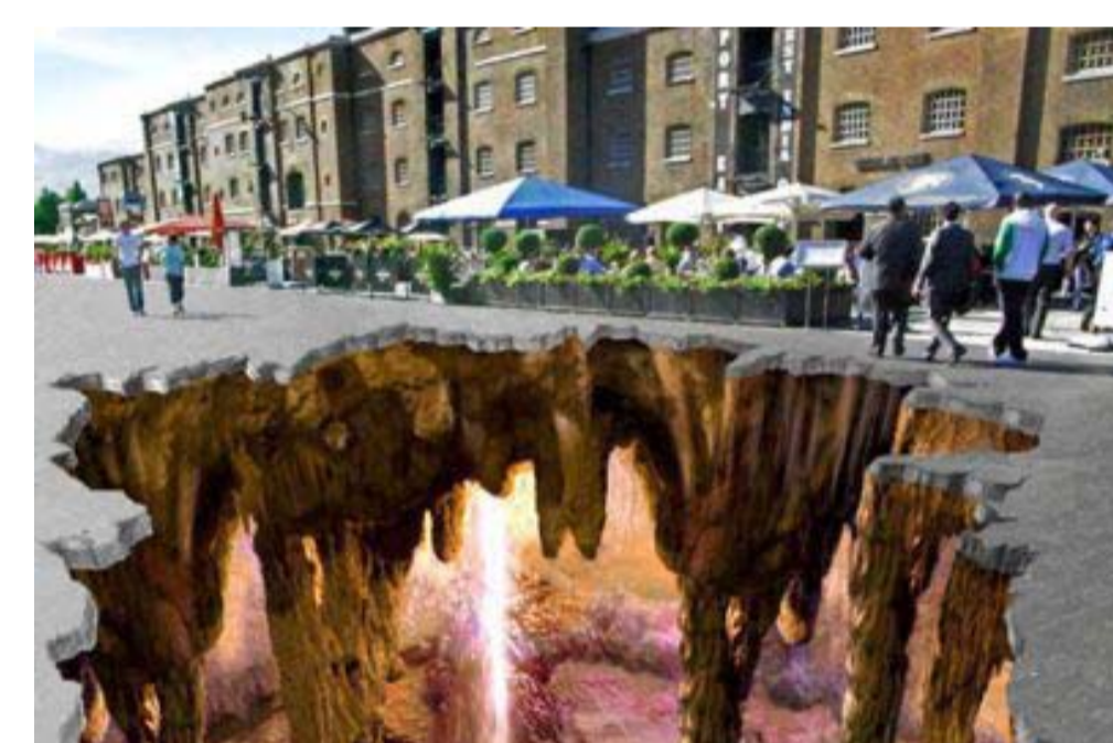
3: KADE ALS GALERIE

De fotomontage laat zien, hoe de kade als verblijfsgebied gebruikt kan worden.