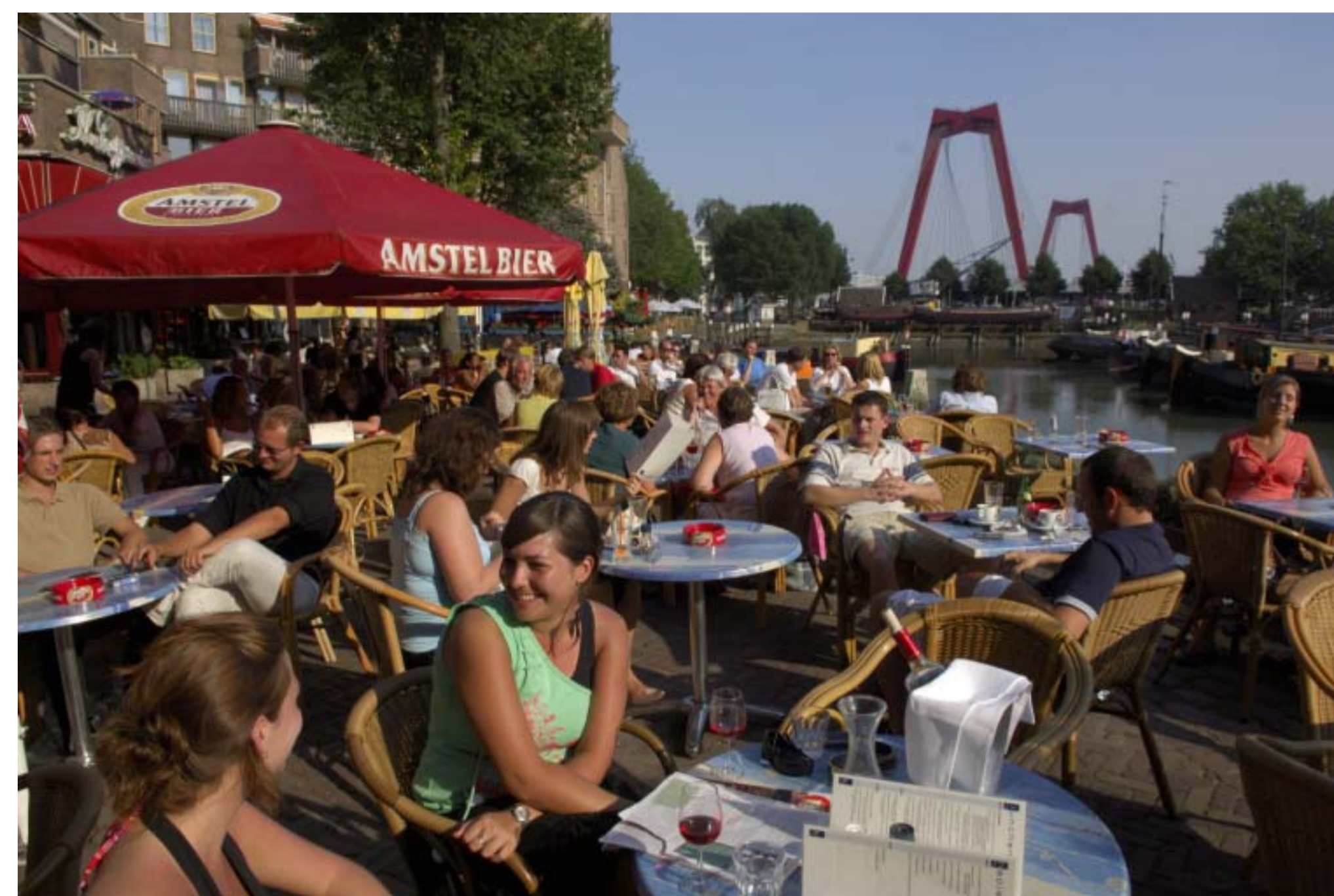
1: NIEUWE PLEISTERPLAATS