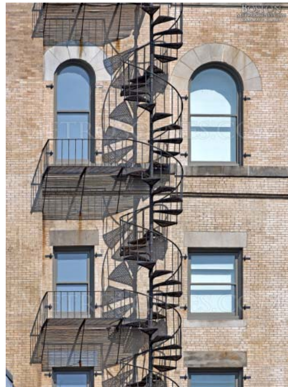
5: TRAP VAN WONING NAAR KADE