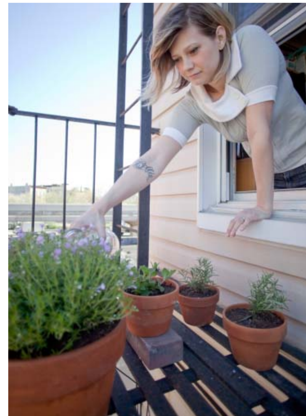
5: BALKON AAN KADE