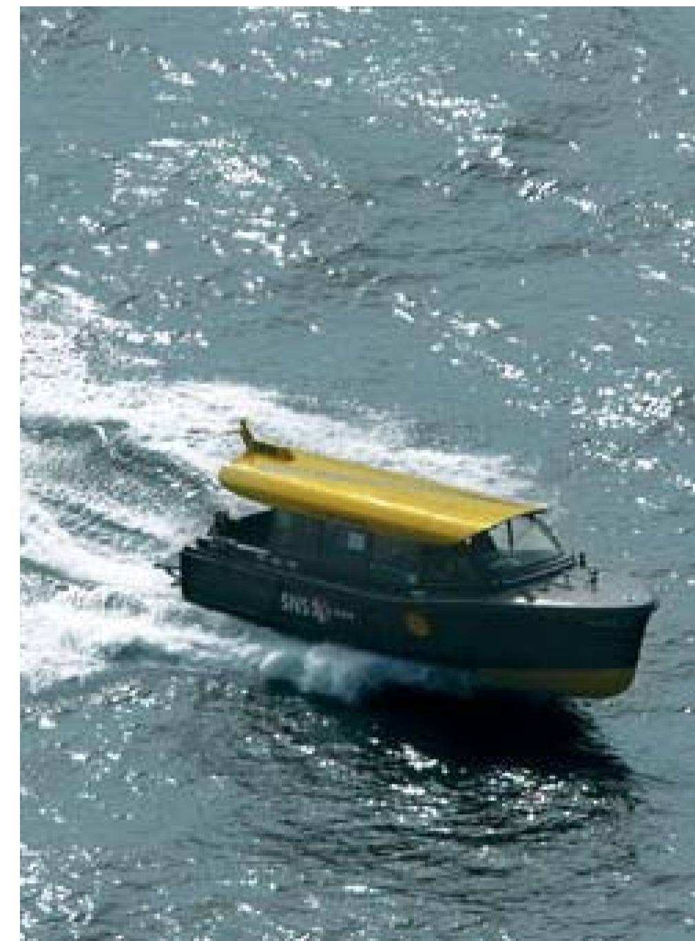
2: WATERTAXI MEERT AAN IN DELFHAVEN