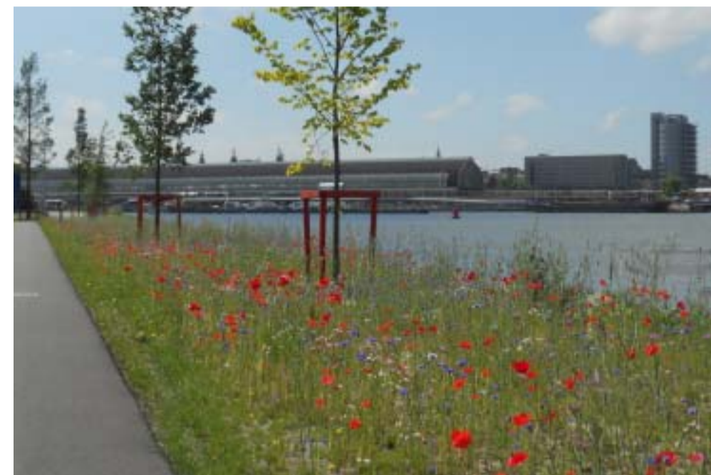
1: MAAK EEN GROENE OEVER