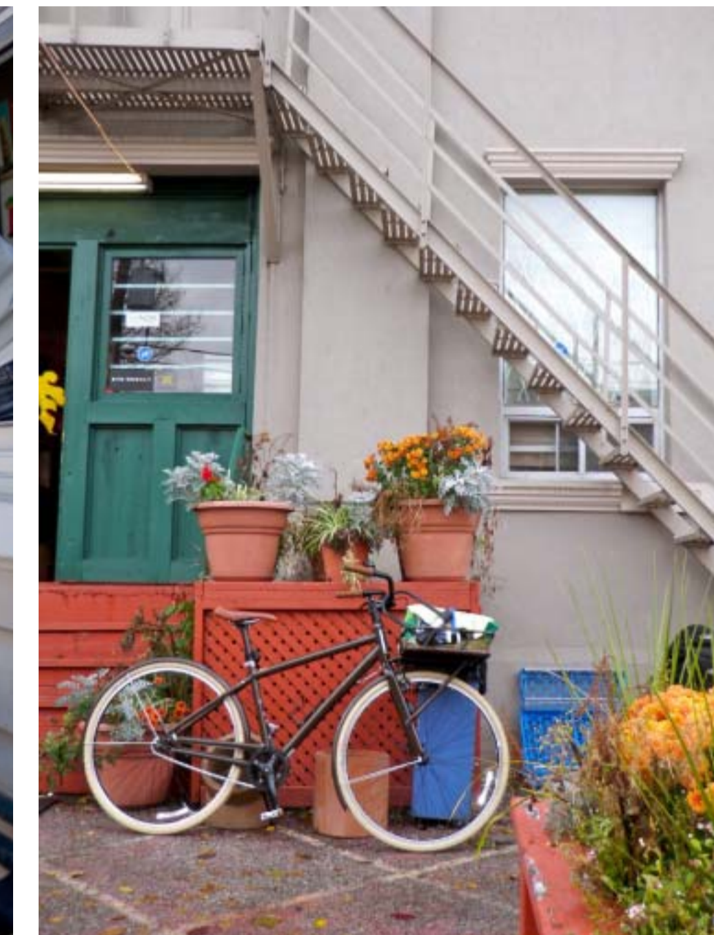
5: TRAP VAN WONING NAAR KADE