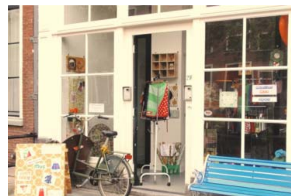
4: WERKEN ONDER JE WONING