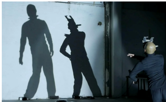
Schaduwspel; try-out september 2013

MERGE viert de vloeibaarheid van de Schie en de veelvormigheid van de mensen en de geschiedenis van Delfshaven. Dankzij de bijdragen van velen wordt het evenement een geschenk aan Delfshaven en aan de stad.