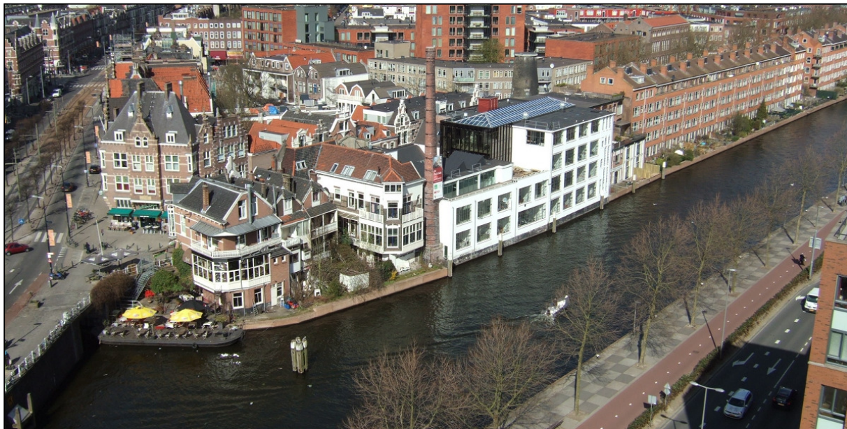
Locatie van MERGE vanaf het 'Hoge Erf' bij de Lage Erfbrug. Rechts de Aelbrechtskade met het 'Lage Erf'. Aan de overzijde de Fabriek met de schoorsteen en de achterzijde van Mathenesserdijk 430.