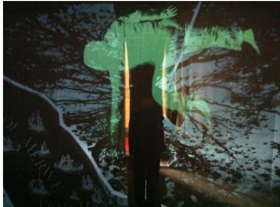
Schaduwspel; try-out december 2013