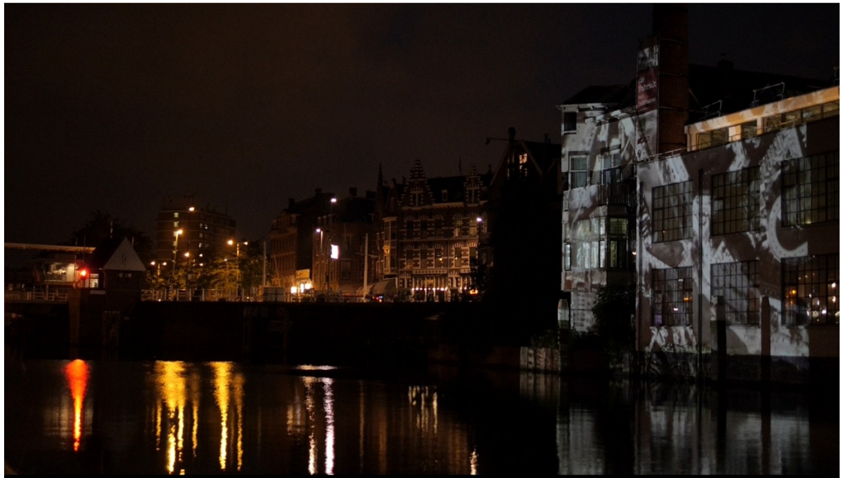
Locatie bij de Lage Erfbrug; beamer test op de Fabriek in juli 2013

Tegen een achtergrond van videoprojecties voeren twee dansers een bijzonder schaduwspel op voor en achter een scherm op een ponton in het water. De videoprojecties op de huizen en de Fabriek creëren een indrukwekkende beleving van deze unieke locatie. Het schaduwspel van de dansers met hun eigen schaduwen, vermengd met historische beelden van Delfshaven, laten op een verrassende manier zien hoe omgeving en lichaam, sferen uit verschillende culturen, heden en verleden, kunstvormen en symbolen in elkaar vloeien ('MERGE').