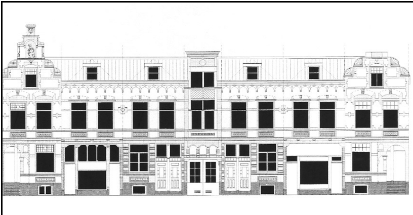
Bestaande gevel Mathenesserdijk 465 – 475 blijft behouden

Eigenaar Patrimonium Woningstichting (PWS) heeft onlangs opdracht gegeven om binnen twee maanden de plannen klaar te hebben voor de renovatie van de 'Driehoekjes'. De bestaande gevels worden gerestaureerd en de panden zelf worden herbouwd. De bouwvergunningen voor de Mathenesserdijk 479, 485 en 487 zijn al verleend, en voor 465 – 475 is de aanvraag voor de bouwvergunning in voorbereiding.