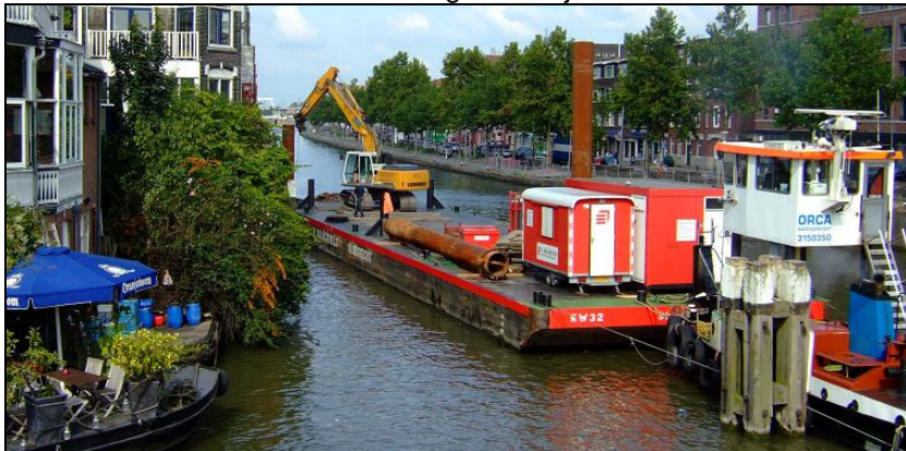
Ponton afgemeerd bij Mathenesserdijk 430

Na 8 jaar van actievoeren is het eindelijk zover. Volgens planning moet het werk 20 december 2008 gereed zijn.