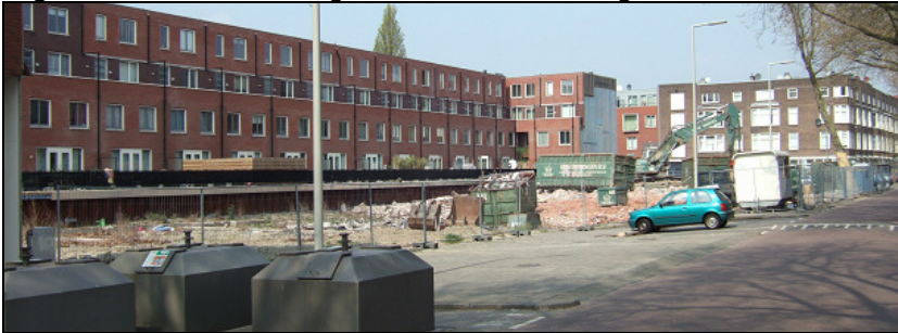
Bouwtterrein met de laatste sloopwerkzaamheden

Op 21 maart startte de sloop van de resterende panden aan Mathenesserdijk 381 - 387 (Doma garage). Ze maken plaats voor de 2e fase van de nieuwbouw van van Dorp. Het wachten is nu op het uitgraven van de fundering en de bodemsanering.