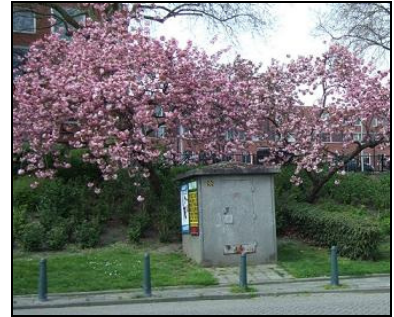
Plantsoen bij afrit naar Spangesekeade.

Op veel plekken op de dijk groeit en bloeit het weer.